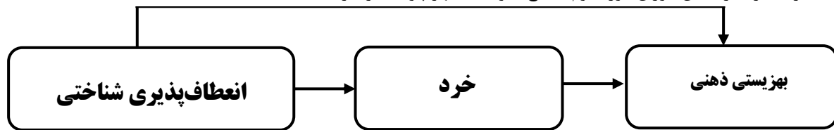
شکل ۱. مدل مفهومی پژوهش

حوادث پیرامونشان را به صورت منفی و نامطلوب ارزیابی می کنند و هیجانات منفی مانند اضطراب و افسردگی بیشتری را تجربه می کنند (هاگیل و همکاران ۱ ، ۲۰۱۸). نتایج پژوهشی نشان می دهد که خردمندی در مواجهه با موقعیت های مشکل زا، توانایی خودتنظیمی هیجانی فرد را افزایش می دهد و باعث تسکین، آرامش و بهزیستی ذهنی می گردد (والش و ریمز، ۲۰۱۷). مطالعات و حتی راهکارهای زیادی را مبنی بر رابطه بهزیستی ذهنی و خردمندی می توان یافت (زاچر و استادینگر ۲ ، ۲۰۱۸). با توجه به اینکه دوره دبیرستان به عنوان تجربه ای جدید، همراه با برخی تحولات رشدی است و هنوز کاملاً مسئولیت پذیری ها و نقش های یک بزرگسال را به عهده نگرفته اند و تغییراتی در فرایندهای هویت یابی، معناجویی، استقلال و حمایت های اجتماعی موردنیاز آنها مشاهده می شود (اسمیت و همکاران ۳ ، ۲۰۲۰) پژوهش در ارتباط با مولفه های روانشناختی همچون انعطاف پذیری شناختی (که یکی از عوامل مهم در تعاملات اجتماعی است) و بهزیستی ذهنی (به عنوان مولفه ای اثرگذار در ارزیابی افراد از زندگیشان و داشتن حداکثر عاطفه مثبت و حداقل عاطفه منفی) حائز اهمیت است. همچنین خردمندی به عنوان مهارت، هدف و کاربرد تجربیات مهم زندگی در تسهیل رشد بهینه ی خود و دیگران، می تواند نقش بسزایی در مواجهه ی دانش آموزان با موقعیت های مشکل زا داشته باشد. لذا سوال اصلی پژوهش حاضر آن است که آیا انعطاف پذیری شناختی بر بهزیستی ذهنی با واسطه گری خرد در دانش آموزان دوره دوم مقطع متوسطه شهر پاره تاثیر دارد؟