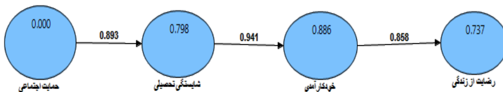
شکل ۱: آزمون مدل تحقیق (ضرایب استاندارد)

حالت تخمین استاندارد ضرایب همگن شده هستند، یعنی مقیاس آن ها یکی شده است و امکان مقایسه بین آن ها وجود دارد. این ضرایب همان ضرایب مسیر یا بتاهای استاندارد شده ی رگرسیونی هستند. در حالت استاندارد ضریب بتا عددی بین منفی یک تا مثبت یک بوده هر چقدر به سمت مثبت یک عدد به دست آمده میل کند شدت تاثیر قوی و مستقیم بوده و هر چقدر به سمت منفی یک میل کند شدت تاثیر قوی و معکوس خواهد بود.